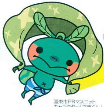
国東市PRマスコットキャラクター「さ吉くん」